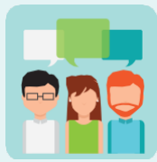
Розуміння та використання сприйнятливої та експресивної мови