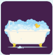
Догляд за собою

Щоб мати право на послуги програм з винятків, людина повинна показати, що їй потрібен певний рівень підтримки, щоб жити та працювати у спільноті. Рівень підтримки вимірюється наявністю значних обмежень у 3 або більше основних аспектах життя: